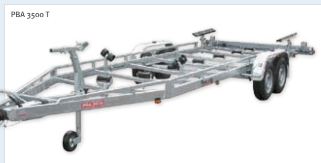
PBA 3500 T